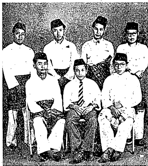
کمبر کناغن مريد ۲ مدرسة الاستقامة العربية فارية باسيلم فوتنيان جوهر.

سڱکوه برهکياله کيت هيديوف دالم زمان سکارغ اينم زمان يځدبرکاتي توهنم تومبوه سوپر برباکي ۲ جنس علم فغتهوان مودنم يځ منفتن مليفوتي جاڳه اين. دري تيمور سمي کبارم دري اوتارا سمي کسلاننم دراساي اوله سکل بغسا يځ تله ماجو دالم فرادفن دان کنگاران. همنير ستيف بولنم بهکن ستيف ميڱو کيت ياج بریتان ۲ تنن اداڻ فنداڳه ۲ بهارو دالم لافغن علم فغتهوانم سباکي حاصل فليديکن تنن رهسيا عالم يځ لواسم دان سکارغ تله دتريما دان دراساي اوله مانسي - کات الاستاذ محمد علي الحبيدي دالم سالا ساتو کوفاسنن. له لنجوة بليو برکات: