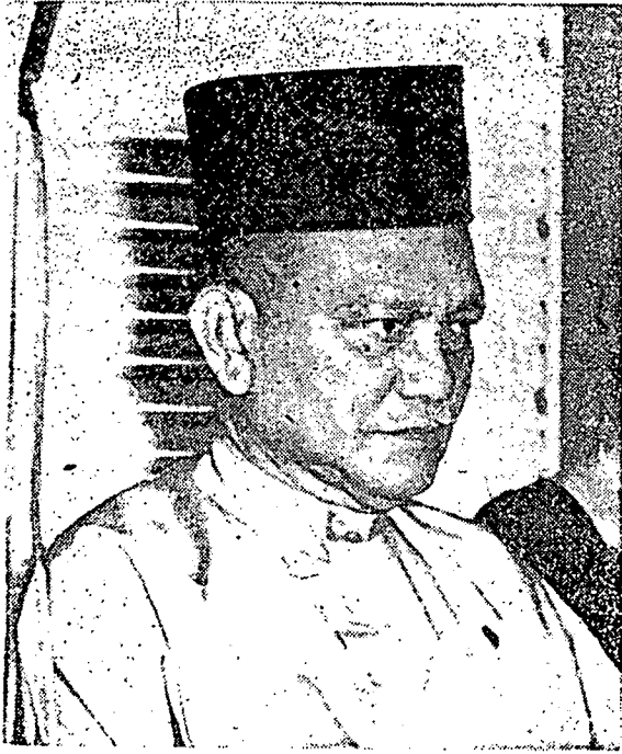
المرحوم توانكو عبدالرحمن ابن المرحوم توانكو محمد يقدفرتوان اكوغ فرسكتوان تانهملايو يقرنام، راج يغ بيچفسان، عادل، فيتمون، بريودي لاي ستيان.