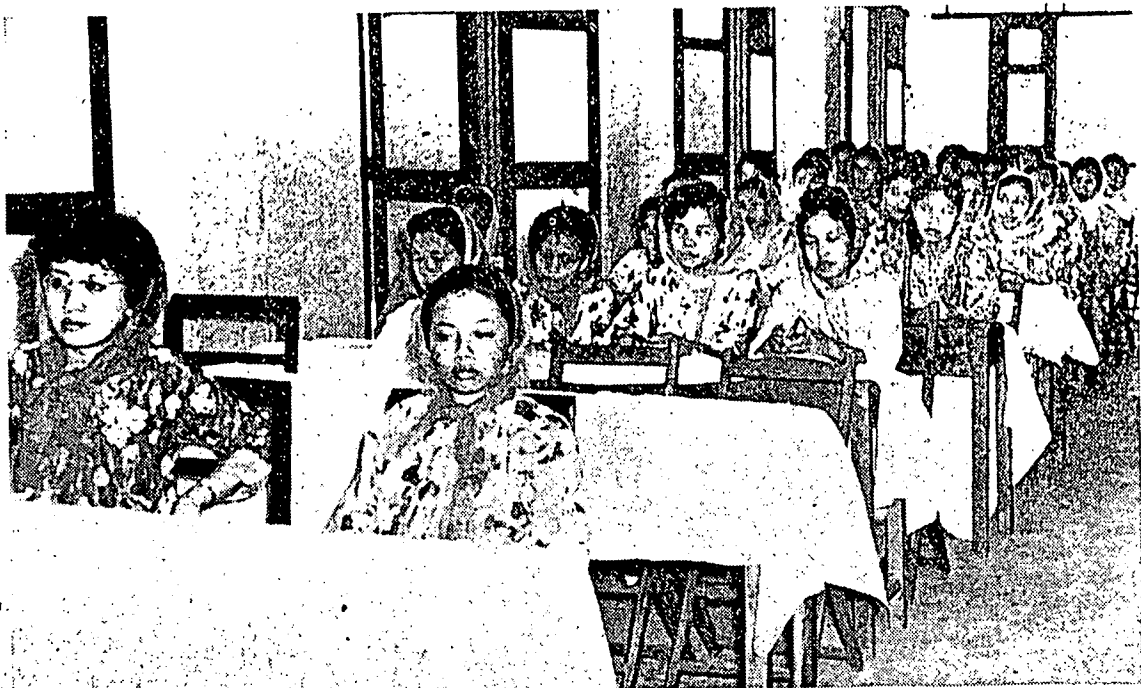
كورو ۲ اكام فرمفوان سيقافورا سدغ برسيدغ انتوق ممينچفكن فنوبهن "فرساتوان كورو اكام فرمفوان سيقافورا" يث نله برلفسوغ بهارو ۲ اين.

فونذوق كچيل يث سويي سفي له بايك دري استان ترسر كم تيغكي.