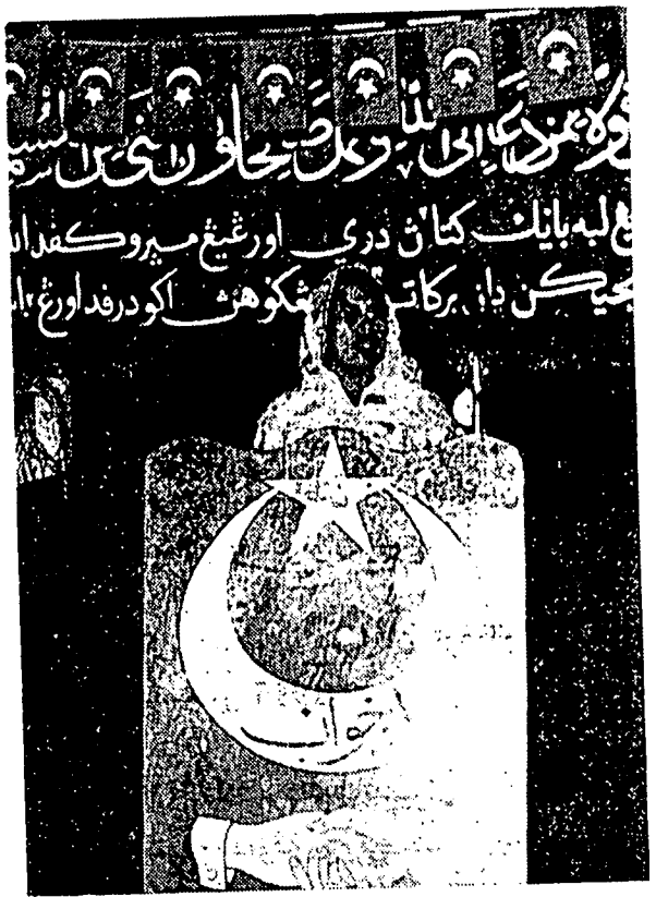
استاذه آمنه بنت فووغ حسین، دغن تیغ دان جلس، سدغ مهوراین سجاره فرجواغن رسول الله دان صفة ان بفترفوجی

دباوه اینم قلم منورنکن دغن سفنوهن کوفاسن سودارا عبدالله العیدروس دمجلس اینتخ صفة رسول الله یغ تله داوتوس اوله الله تعالی منجادی رحمة باکي سلوره عالم. اوچرن دن ددالم القرآن الکریم، الله تعالی برفرمان ارئین: "تیدقله کامی اوتوسکن کامور (یا محمد) ملینکن اداله کران مباوا رحمة کیت"