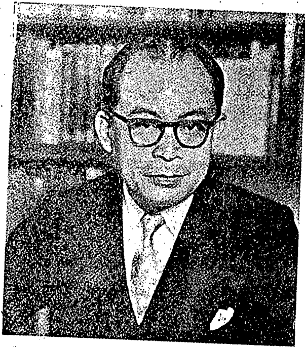
دفتور محمد حتی

دپتاکنن برلاکوڻ کمالی اوندغ ۲ داسر تاهون 1945. منوره واندغ ۲ داسر 45 ایت فریسدینه ریفلیک اندونسیا اداله کهلا بدان فراوندانن فارلیمنه یغ اد منوره اوندغ ۲ داسر 1950 دان ترسوسن منوره فیلیهن عموم فد تاهون 1955 داکوئی سباگی دیوان فرواکیلن رعیه سمنتارا سمفی تربنتوق دیوان فرواکیلن رعیه بهارو برداسرکن اوندغ ۲ 1945. سگوهفون تیندقنن فریسدینه ایت برنتاغن دغن فرلمبکان دان مروفاکن سوات رمفاسن کواسم ای دبرکن اوله فارتی ۲ دان سوارا یغ ترابلق ددالم فرواکیلن رعیه. گولغن کچیل معاغکف فربواتن فریسدینه ایت سباگی سوات تیندقنن - فرکوسام تنافی میسوایکن دیرین کغد کپتان یغ بهارو ایت. دغن فنديرین سدمکین دیوان فرواکیلن رعیه سوده ملفسکن