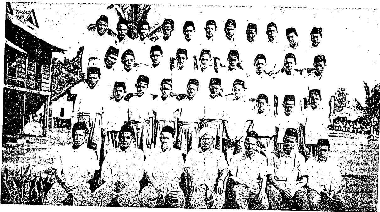
سهاكين دري فننتوة للاكي مدرسه نهضة الوطنيه كوه دياغ - قدح بر كمبر رامي دغن كورو ۲ دان فقلولا مدرسه فد هاري احتفال دان مجلس بجان القران الكريم بهارو ۲ اين

تيف ۲ سورغ داتارا كيت ترتتوة براوسها دان بكرج برسكوه ۲ اتوق مبريكن كبايكن سباقن ۲. مدهنداغن دغن ايت الله جاديكن بأيك كادان كيت قوم مسلمين - امين يارب العالمين.