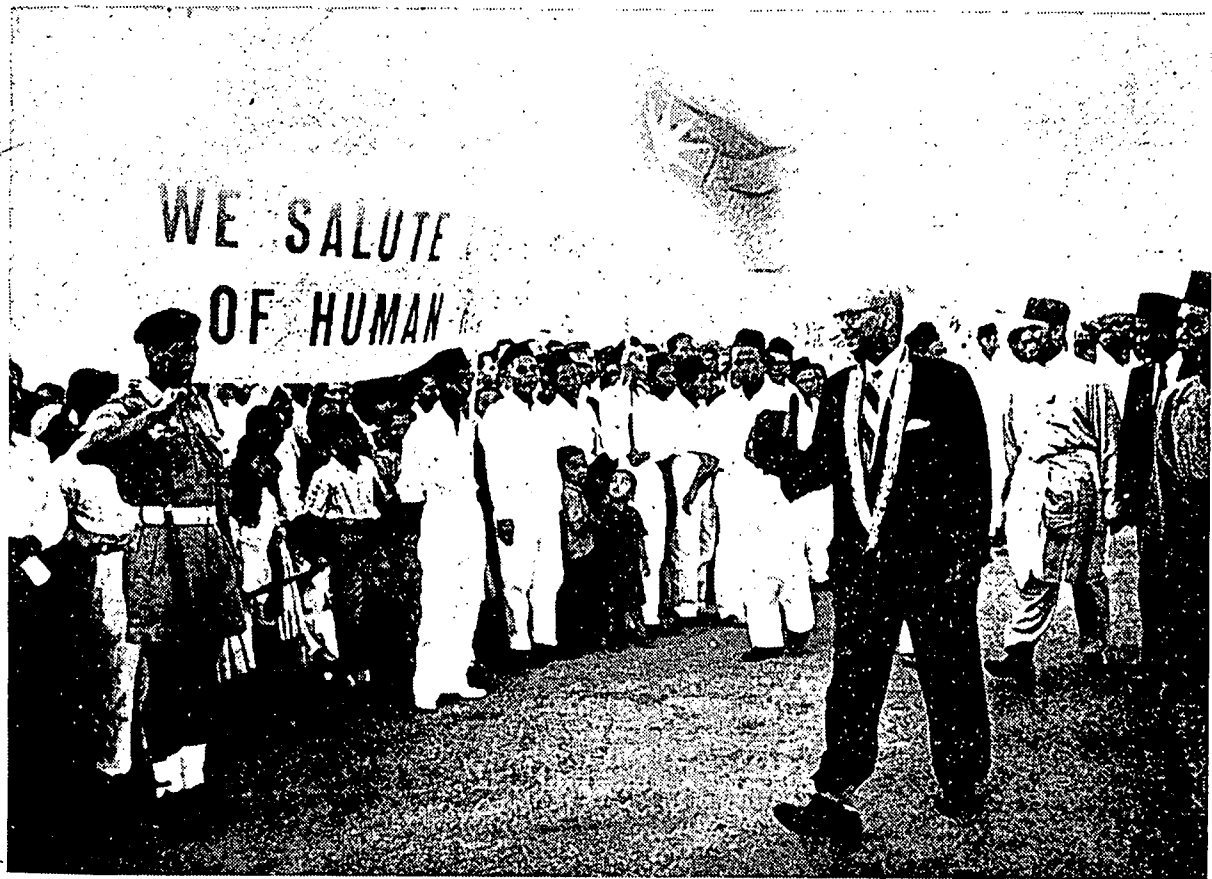
فزدان منتري فرسکتوان تانهملایوم تفکو عبدالرحمن فترا الحاج سدغ دسمبوة دغن مریاهن کنیک بلیو تیبیا دری لندن بهارو ۲ این.

تراوتمان، عالم علماء، ستله مفکاجی دغن سقسام اتسن اوندغ ۲. این، باکی منچاری فرفادوان دان سفاکه اومه اسلام، مک فاس سیفافورا تله مفاداکن فرجمقان عام بدان ۲ اسلام سیفافورا. ددالم فرجمقان یشدحاضری سراتوس بدان ۲ اسلام دسیفافورا مک دغن سبولة سوارا تله مقمبیل کفوتسن بهوا بدان ۲ ایت منتوة کفد کراجان سیفافورا سفای مناریق بالیک رغ اوندغ ۲ ترسبوة انتوق دفولکن کفد مجلس اسلام فنصیحة کراجان سفای مپمقن سمولا دغن ملتیق سوات جواتنکواس کچیل تردیری دری علماء ۲ ددالم مجلس ایت دغن منجمفوة