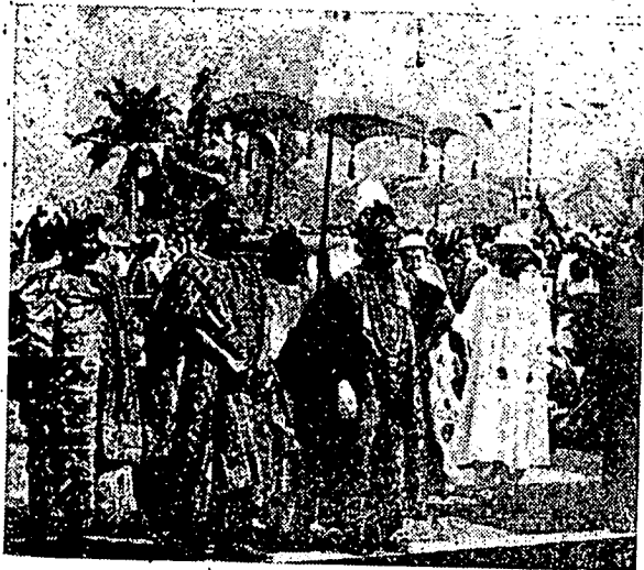
سوات گرامین دراج دنیجیریا.

ملاریکن دیری. ای سکارغ سدغ تیغکل دبندر «باماکو» ایبو نگری مالی سباکی اورغ فلارین فولیتیک.