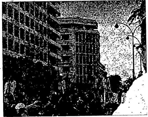
سوات فمنداڅن دبندر داکارم ايوو نکري سينيکال - دافريکا باره.

نکري توکو فرنجيس فول تله مندافه کمريکاټن فديولن افريل 1960. فندودقن برجمله