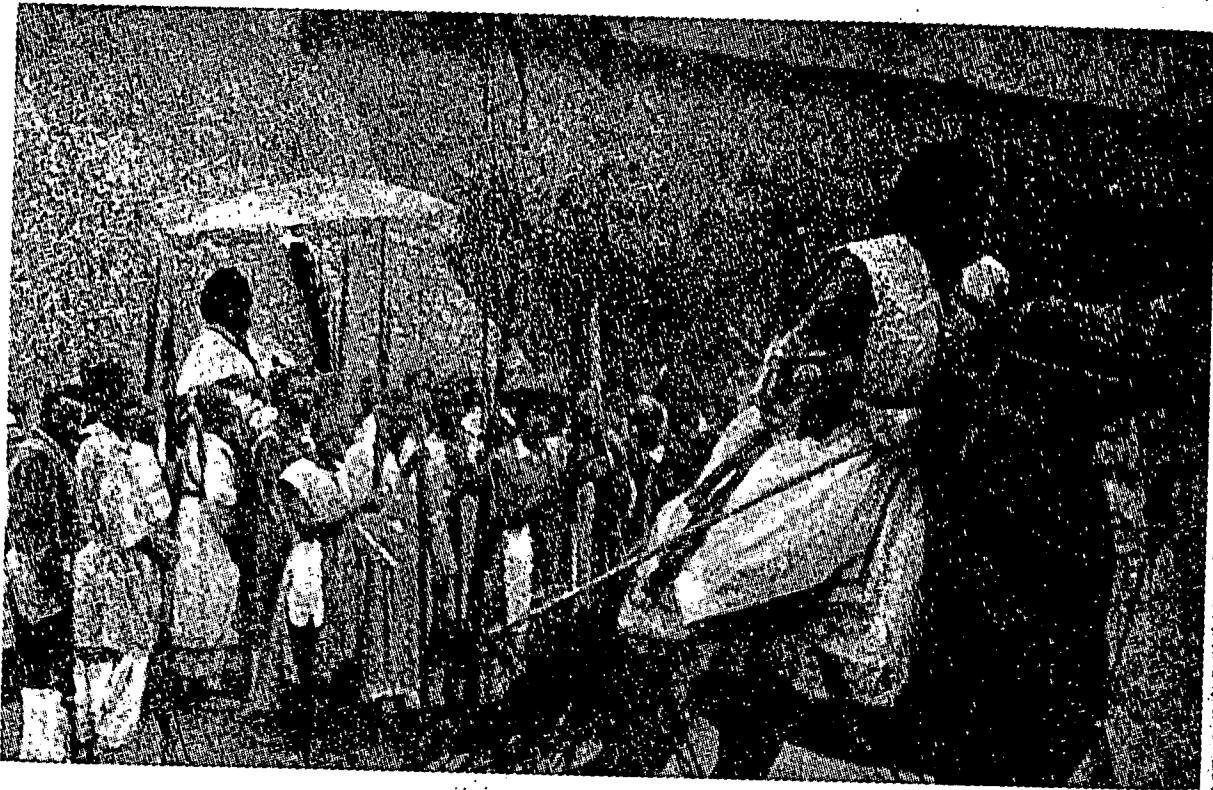
رعية ڪامپرون سدغ مفارق فهميفينن دغن سڪل عادة استعدادتن.

نڪارا ڪينيا ايله نڪري فريسيدن احمد سيڪوتوري ايت نڪري يڻ تله منتخ جنرال ديڪول ڊالم فيلپن راي يڻ داداڪن اتتوق تانه ۲ ججاهن فرنجيس دهولو دان دغن تڪس مٿاڪن ”تيدق“ ڪهد جنرال ديڪول، ڪرن ڪينيا تيدق