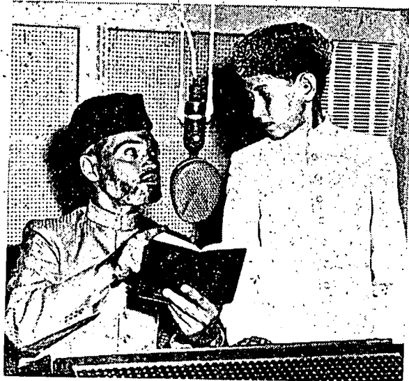
توان زاهر قاسمي دان واحد ظافر (برعهور 13 تاهون) قاري ۲ دري فاكيسنان يفتله مفردغرکن بچانن دفرتنديفن قرآن انتارا بشسا دکوالا لمفود فد تاهون يغ لالو.