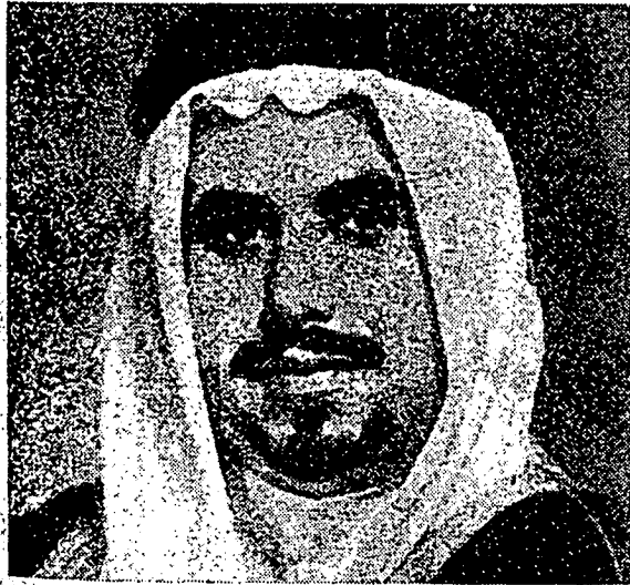
الشيخ جابر الاحمد الصباح منتري اقتصاد نكارا كويت.

قوم بوروه دكويت مزدافه جامينن ييغ سلايقن. كمترين حال احوال مشاركة تله مغلواركن اوندغ ۲ اتتوق مغلوار فرهوبمن بوروه دغن ماجيكن، دان ساتو اوندغ ۲ لاكي اتتوق فكرج ۲