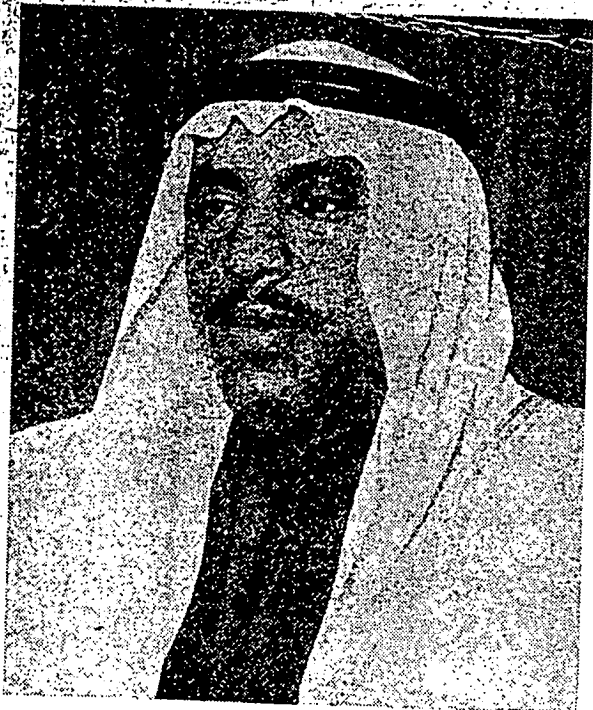
الشيخ سعد عبدالله السالم الصباح منتري دالم نكري نكارا كويت.