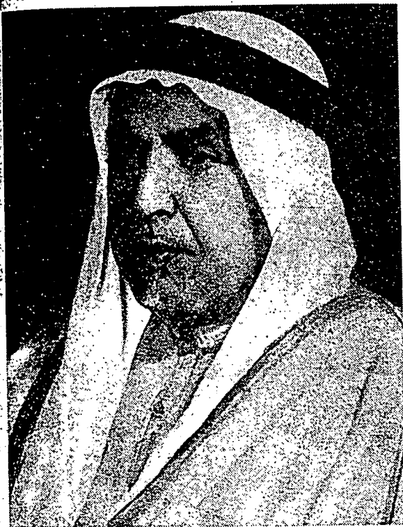
امیر (راج) نکارا کویٹ، الشیخ عبداللہ السالم الصباح.