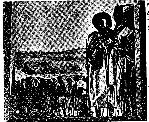
اينله جنسن تنترا ۲ يمن.

كجاځين دبروني اداله ساتو فلاجران يغ ماسيه بلوم لمبه باكي برتيدق، بوځن تيدق اد تناك ۲ يغ جوځر دملايا اين يغ دافه ايځوه منځكځن ديموځراسي دملايا، اځنتافي ځران تناك ۲ اين