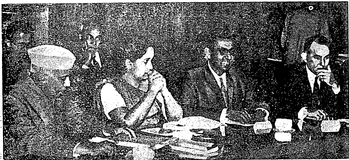
پوپا بندرانايکي، فردان من تري سيلون، رسام ۲ دغن فپوکفن ۲ سنجمفاي فردان من تري انديام توان نيهرو (کيري)، کران مرونديفکن شرط ۲ دامي ددالم فربالهن دانتارا انديا دغن چينا.

اين ترغ فول بهوا سوکفن رعية کفدان فون تيدق اد توبوقتي سکلين فڃيکونن ۲ تله منيڄکلکن دان فرجواڄنن ترڃکالي.