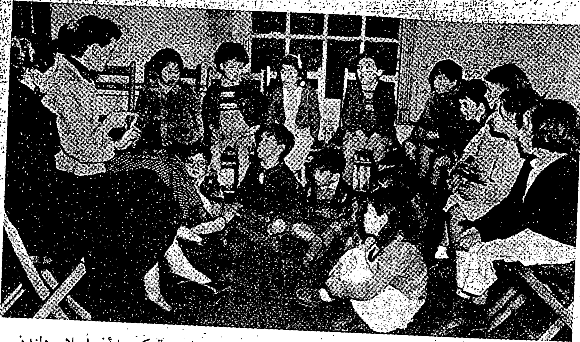
کلس فلاجران اکام اسلام یقديبريکن اوله سئورغ وانيتا دفوسه کبودايان اسلام دلندن کهد سبهاگين درفد کاتق ۲ اسلام.

بربواه بقتي کهد مشاركة دغن جان مغهولرکن دان مغلوارکن کهد مريک برجيس ۲ فکايں دان بوکنله سات ۲ کران کاجي یغ دفراوليهين ايت. بوکن فول اتتوق مندافه فوجان ۲ درفد فغورس دان کتوا ۲۸، جوک تيدق مغهارفکن کريضان دان فبالسن مشاركة دري توکس یقتله دلقسناکن ايت تيدق لاءين فغهارفن ملينکن اتتوق مندافتکن کامفونن دان کريضان توهن دغن جانن دان چارا یغ تيدق برتتاغن دغن فري کمانيسيان دان دسرتاي دغن اغکارا مرک.