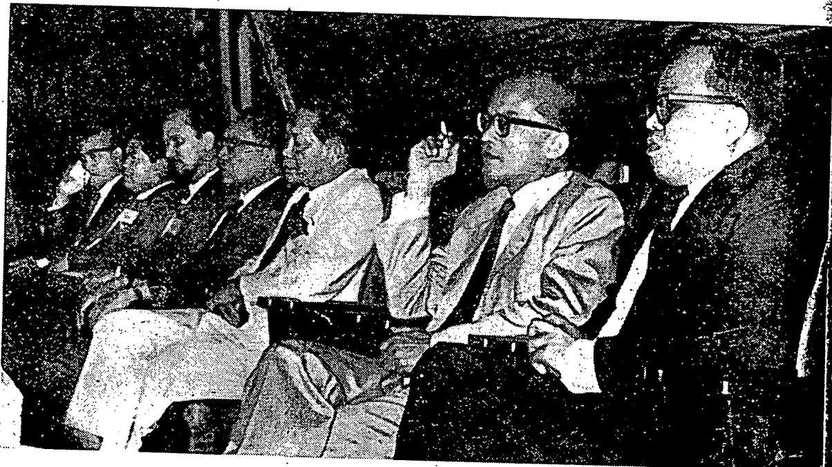
سپهاکین فناج ۲ یغ ممیوای کرتس ۲ کرج یغ دجادیکن روندیقن دان فریجائن ددالم فرسیداشن کوغگریس ایکونومی بومیفتر یغ دادکن دکوالا لمفور.

رؤه انتوق ممفربایککی، ایکونومی بومیفتر این، دغن چارا یغ سماچم این دافه کیت منجافی جان ۲ یغ چمرلغ، کرتس ۲ کرج کوغگریس این دان جوک فان ۲ یغ دفریوای اوله کوغگریس فد هاری این منجادی فندوان کفد کراجان دان کفد مارا انتوق منجالنکن توکس ۲ مریکئیت، سفرت سای سبوتکن فد فاکي سمالم سفکھفون دالم ایسا مماجوکن ایکونومی رعیه این کیت برکھندقکن مفکوناکن حاصل ۲ بومی یغ اد نکارا کیت این سفرت بیجینه کتہ، بارغ ۲ کلوارن دن دان سباکین، تتافی حاصل اتو کفوانن یغ شتق سکاکی یغ فاتوۃ کیت کوناکن دالم لافنن ایاله کفوانن تناک رعیه، کیت مستحق مفکوناکن اورغ ۲ یغ ممفویای فغالمن، فقتهوان، شماغه دان جیوا کبشان انتوق منجادی اهل ۲ مارا این دان منواغ برسام ۲ ملقسناکن داسر دان ریجاشن ۲ دان حسره کیت هندق ممفربایککی