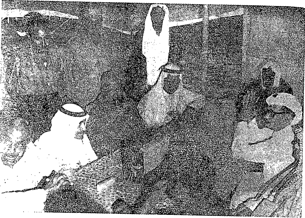
افگوت ۲ فرروس فردامین دالم سیدغن دالحرض.

فرسیداغن دامی این تله دادکن دسوات تمفة برنام حرض دیمن یایت فرسیداغن درفد لنجوتن فرستوجوان دانارا کراجان عرب برساتو دغن کراجان عربیه سعودیه دالم مسئله دامی دیمن. مالغن فرسیداغن این نمغن مونکین کائل دان تیدق برجای دان هاروس منیمبولکن فرلاوتن سهولا. فیلق کبشسان، دالم فرغ یغ لایو دسوکغ اوله تنترا عرب برساتو دان فیلق راج دسوکغ دغن سنجات اوله کراجان عربیه سعودیه.