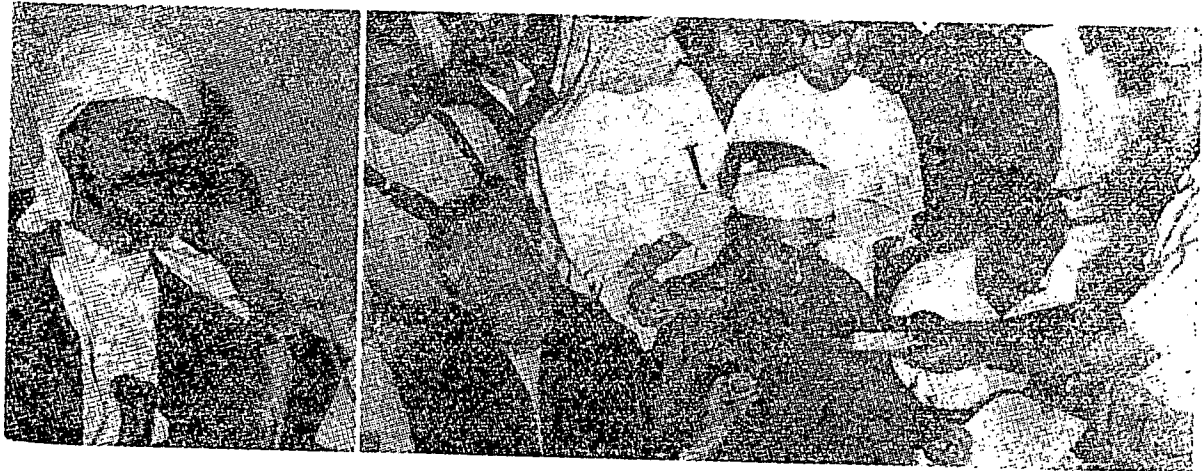
وكيل ۲ دداليم سيدغ دتمورامه اوله ورتاون ۲.