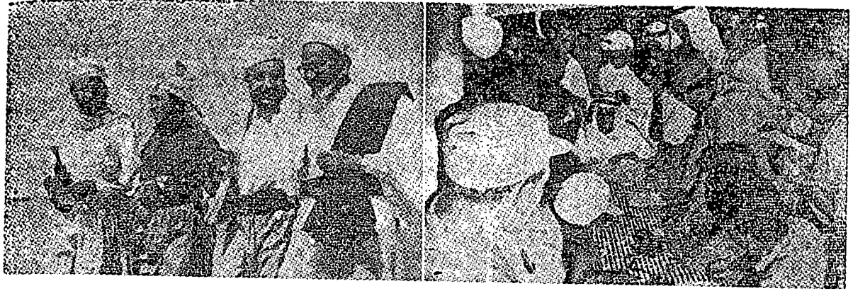
كانن ورتاون ۲ سدغ مفادكن تمورامه دغن الشيخ عبدالله السديري كتوا سيدغ. كيري: اورغ ۲ ايران دان شام منوجو سيدغ.