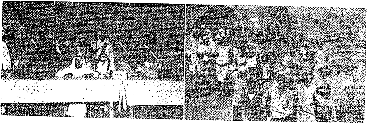
دكانن: فندودق حرض برامي ۲ ميمبوة اشكوت ۲ سيدغ. كيري كتوا سيدغ الشيخ عبدالله السديري مبوك سيدغ.