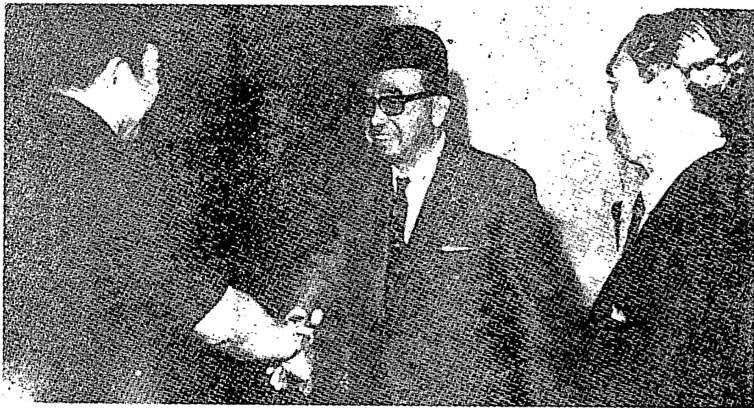
“خبر تفكو؟” بكيتهله فرتيان يىغ دكموكاكن اوله فريسيدنه سوكرنو كهد تون عبدالرزاق سوقت تون منزيارهي بليو داستان مردنكا جاكرتا. “خبر بايك ساج؟” جواب تون.

جى ريكن رث تندق سازك م الله م يىغ سوا سلام حكوم سركن جارا اكام ككن وانن ن دان اغثله افة اي مي كات ماهو تنامو ي بن جاشن ابت رماتن كالو اكن رخبر ن -