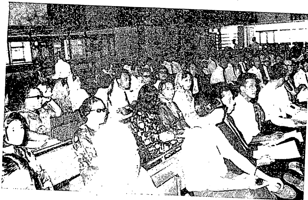
نارا فمراهاتي رسمي سدغ عاشيق مفيكوتني فربحانن 2 هاغلة يىغ برجان دغن لنچر ددالم سيدغ كوئنگريس.