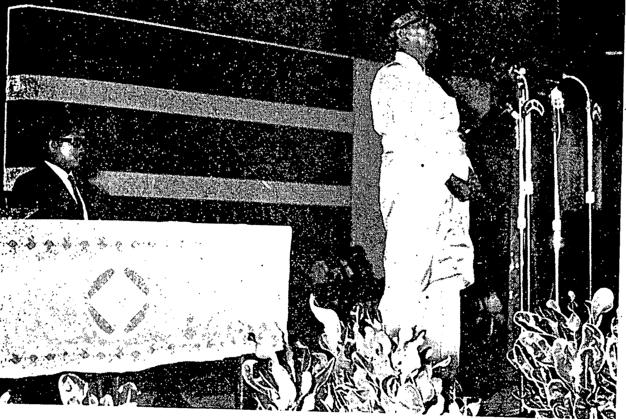
یغ ترامة ملیا تفکو عبدالرحمن فترا الحج سدغ براوچف مرسمیکن فمبوکان کوغکریس ان اسلام یغ