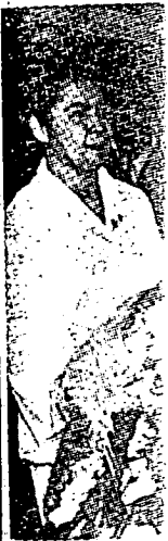
فوان راحا ك كاوسترايا سيمنا كچ چوچو هسو دامبيل