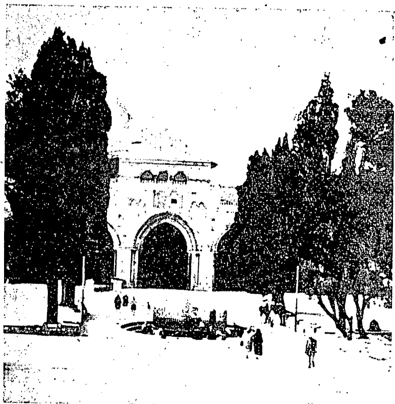
مسجد الأقصى دبيت المقدس.

فرجواغن ۲ یغ تله دلنچرکن اوله اوتوسن ۲ الله ايت مروفاکن سباکي فپلامه دان بکس ۲ انو کسن ۲ فرجواغن سوچي مريکنييت ماسيه دافة دليهه ماسيه بوايه دکنغ ملاووي تیک مسجد یغ اوتام، دالم اسلام. کتيک ۲ مسجد اکوغ ايت مقندوغي سجاره فرجواغن اوتوسن ۲ الله اي مباوا حکمه دان اعتبار یغ تيدق اکن هايسن ۲ باکي مريک یغ منزيارهين سمپيل مرونغ کزمان لمفاوم کزمان کبقيکتين اسلام یغ کيلغ کميلغ.