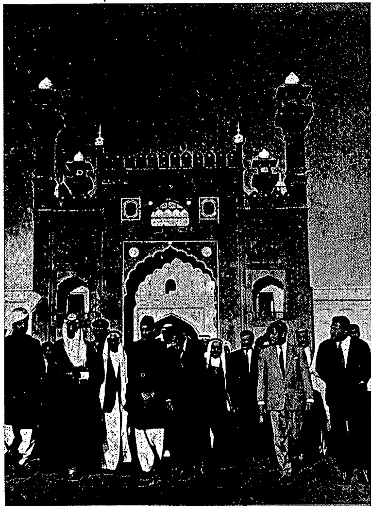
ملك فيصل بن عبدالعزيز دري سعودي عربيا سدغ كلوار دري مسجد بادشاهي سوقت لاواتن بگندا كنكارا فاكستان فد تاهون 1966 يغ لالو.

تاهون 721 مسيحي، كفل ۲ لاير اسلام يغ بلاير دري سبواه ججاهن اسلام دسيلون كهريه، تله برلابوه دديبل، سبواه فلاپوهن دكة كاراچي دفاكستان بار۲، دان فمريته سيند، راج دهار يغ براكام هيندو، تله مرفس بارغ ۲ مواتن كفل ۲ ترسبو۲ دان اورغ ۲ اسلام دكفل ۲ ايت دفنجاكنم، اين ميبكن خليفه اميه يغ فد ماس