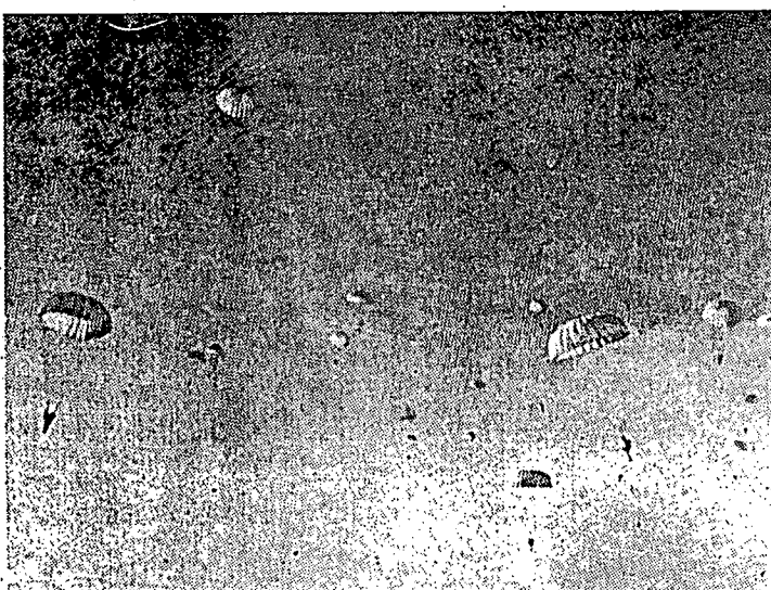
فاسوقن فايوغ ترجون مغمبيل فرانن اوتام دالم اشكاتن فرغ نكارا ۲ اسلام دزمان مودن.

افيل اغكو برفسه دري دغن بسورغ، مك هندقن فرافيساهن ايت دلاكون دغن بايك ددالم فركتان دان فربواتن ۲. كزان اغكو تيدق تاهو بارغكالي فد سوات ماس ننتي اغكو اكن برجمفا لاكي دغنن. (الهمزاني)