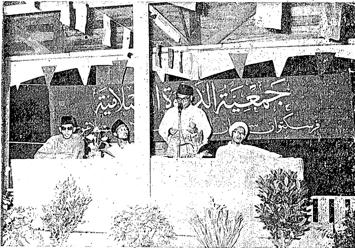
سبائي سبواه، بدان دعوه اسلام يغ تربسر دمليسيا "فرسكتوان اسلام ملايا - سلاغور فد ستيف بولن تيداق فوتسين ۲ مفادكن سيزي ۲ مجلس اكام ممفرايقاتي سجاره ۲ فركمباغن اسلام دري سحج 13 ابد يغ سيلم، كمبر داتس منجوقكن ساتو مجلس ممفرايقاتي "نزول القرآن" يغ تله دادكن فد بولن رمضان يغ لالو دديوان شراحن مسجد جامع بندر - كوالا لمفور.

فركتان بوغ (فلسو)، دغن تولس اخلاص كزان الله، تباد مفركوتوكن سسوات دغنن. نارغسياف يغ مفركوتوكن الله سنوله ۲ اي جاتوه دري لاغيه، تروس دسمبر بورغ اتو تربفكن اغين كتمفة يغ حاوه... دمكىله كادان (اورغ يغ شيريك)، نارغسياف يغ مفحرماتي شعار اكام الله مك، قربواتن ايت تربيتن درفد هاتي يغ تاكوة كفي الله ۴، (سورة الحج، 32-30)