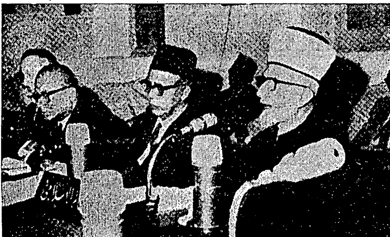
توان سيد امين الحسيني دان توان محمد ناصر داوندغ خاص مقاضري سيدغ "كوكريس اسلام سدنيا" فد تاهون يغ لالو.

سبوم عبادة سمبيغ دجالنكن، دوا خطبه يغ مقندوغي نصيحة، علمو فقتهوان، دان فقاجران۲ يغ بركون انتوق دجادين فندوان باكي مفهادفي چابران۲ هيدوف، دفيداتوكن دري انس منبر اوله شورغ خطيب يغ سننيسا منانمك سماغة كسدارن دان روح كانصافن كدالم جوا فارا فندشر سرت ممبري فرايخان كغد