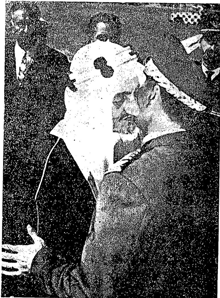
سوات لاواتن فرضحابتن يڭ دادكن اوله دولي يغمها مليا شاهنشاه ايران محمد رضا فهلاوي كنكارا سعودي عربيا فد بوان يڭ لاهو، تله دسمجوة دغن بكيته مسرا اوله دولي يغمها مليا ملك فيصل دلافغن تريڭ انتارا بقسنا دجده.

فرتموان اينله يڭ دنمان ”حج“، عبادة حج اداله مروفاكن سوات فرفادوان اومه اسلام سجائكم فرفادوان يڭ مرافتكن هوبغن لاهير دان باطن انتارا سسام اومه اسلام يڭ جاوه دان دكته مرافتكن صلة الرحيم انتارا اومه اسلام دنبوا اسيا دان افريكام مرافتكن راس فرسوداران انتارا اومه اسلام يڭ داتڭ دري نكارا ۲ تيمور دان باره، كداتغن مريك سموا برهمفون دسوات تمفة يڭ تله دنتوكن توهن اداله دغن ممباوا حسرة يڭ ساتو دان دغن چارا فكاين يڭ ساتو فول يايت منونيكن فقكيلن الهي يڭ ترجائيه ددالم فرمانن يڭ بررويي ”ولله على الناس حج البيت من استطاع اليه سبيلا ومن كفر فان الله غني عن العالمين“